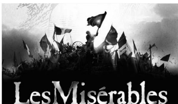
Victor Hugo va escriure Les Misérables el 1862, i encara se sent la gent cantar.

"No sentiu la gent cantar / el cant de l'home alliberat / És la cançó que canta el poble / que no vol ser empresonat / Per als pobres d'aquest món / brilla una flama que mai mor / Qui s'apunta a la croada? / Qui s'uneix als vencedors? / Construïnt les barricades / hem bastit un món millor / on tots serem lliures / i podrem viure amb honor / I la terra semblarà / com el jardí del Paradís / un bell indret amb alegria / on tothom serà feliç / i l'horitzó per fi / s'albira la llibertat / ..... No sentiu la gent cantar / el cant de l'home alliberat / és la cançó que ja anuncia / el nou món que va arribant / Que el batec dels nostres cors / s'uneixi al ritme dels timbals / i llancem als aires / l'esperança d'un nou demà".