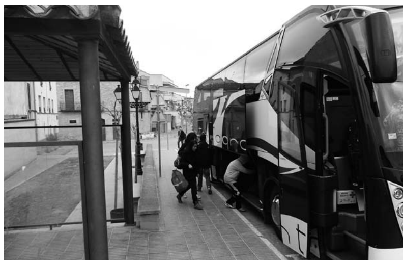
Les bosses a baix